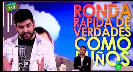
Ronda rápida de ...