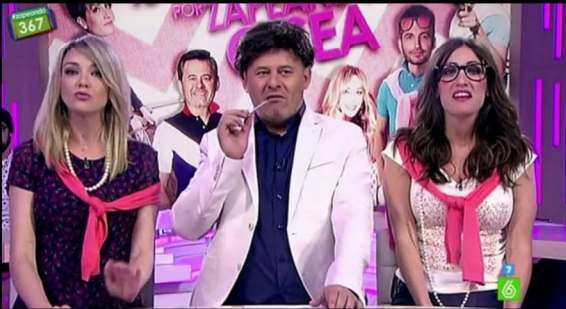
Te lo juro por Zapeando, osea.