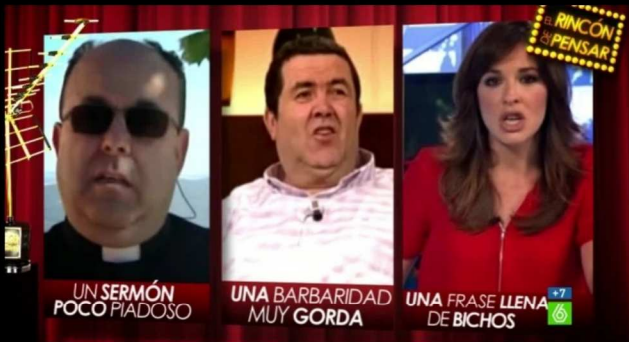
El rincón de pensar