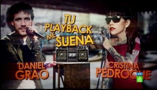
Tu playback me suena.