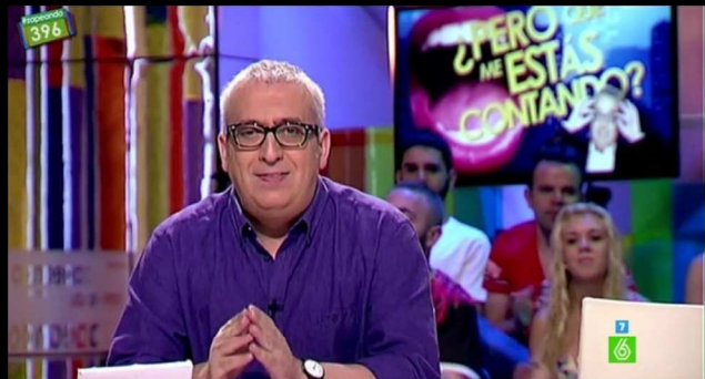
¿Pero qué me estás contando?